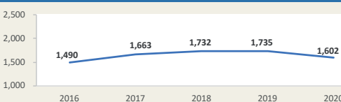
CALLAO - Evolución de movimiento portuario Enero - Setiembre (Miles de TEUS)