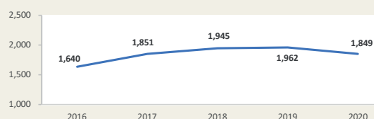
Evolución de movimiento portuario Enero - Setiembre (Miles de TEUS)