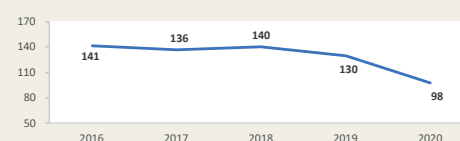
Movimiento de carga vía aérea del Callao Enero - Setiembre (Miles de TM)