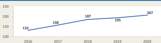
PAITA - Evolución de movimiento portuario Enero - Setiembre (Miles de TEUS)