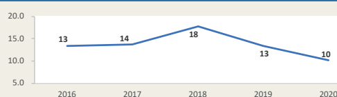
MATARANI - Evolución de movimiento portuario Enero - Setiembre (Miles de TEUS)