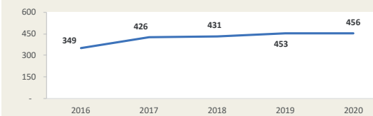
Evolución de movimiento portuario Enero - Febrero (Miles de TEUS)