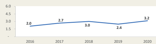
MATARANI - Evolución de movimiento portuario Enero - Febrero (Miles de TEUS)