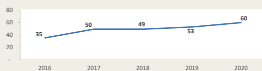
PAITA - Evolución de movimiento portuario Enero - Febrero (Miles de TEUS)