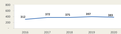
CALLAO - Evolución de movimiento portuario Enero - Febrero (Miles de TEUS)