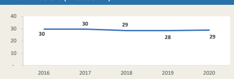
Movimiento de carga vía aérea del Callao Enero - Febrero (Miles de TM)