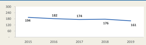
Movimiento de carga vía aérea del Callao Enero - Noviembre (Miles de TM)