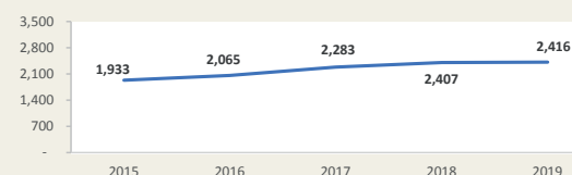
Evolución de movimiento portuario Enero - Noviembre (Miles de TEUS)