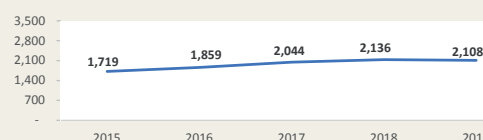
CALLAO - Evolución de movimiento portuario Enero - Noviembre (Miles de TEUS)