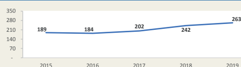
PAITA - Evolución de movimiento portuario Enero - Noviembre (Miles de TEUS)