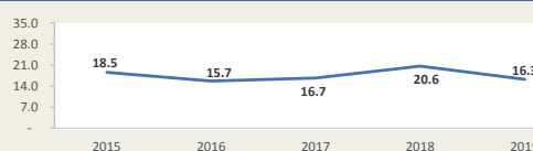
MATARANI - Evolución de movimiento portuario Enero - Noviembre (Miles de TEUS)