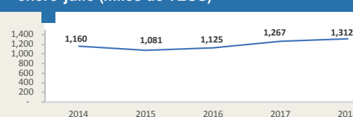
CALLAO - Evolución de movimiento portuario enero-julio (miles de TEUS)