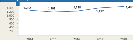
Evolución de movimiento portuario enero-julio (miles de TEUS)