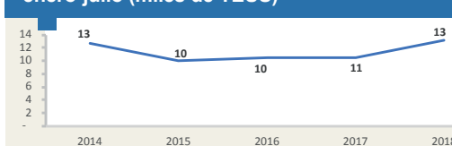
MATARANI - Evolución de movimiento portuario enero-julio (miles de TEUS)