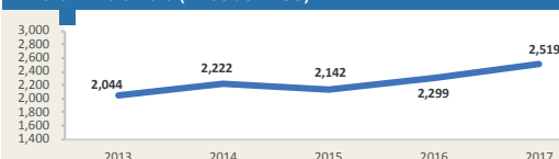
Evolución de movimiento portuario Enero - Diciembre (Miles de TEUS)