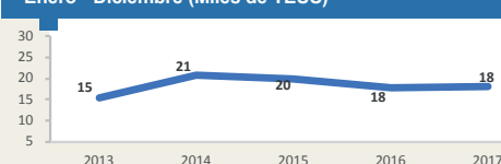
MATARANI - Evolución de movimiento portuario Enero - Diciembre (Miles de TEUS)