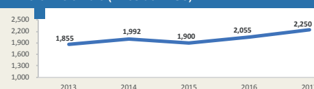
CALLAO - Evolución de movimiento portuario Enero-Diciembre (Miles de TEUS)