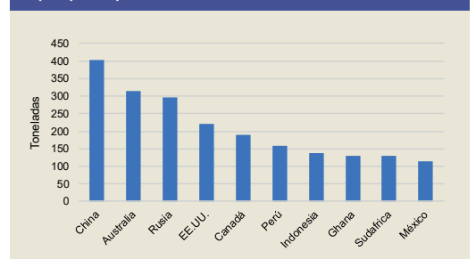
Top 10 países productores de oro 2018