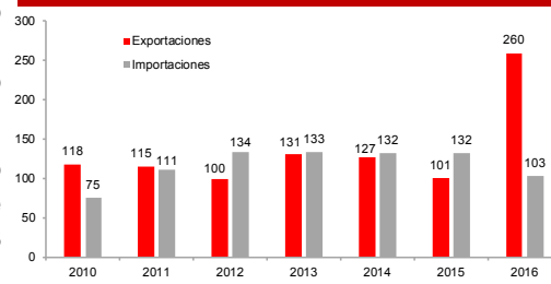
Comercio bilateral Perú - Australia (US$ Millones)

En cuanto a los productos que exportamos hacia este país, un 81% correspondió al rubro tradicional en 2016, siendo el zinc y sus concentrados el más importante (US$ 102 millones), seguido por el plomo (US$ 57 millones) y el cobre (US$ 23 millones); mientras que las exportaciones del rubro no tradicional abarcaron un 19% del total.